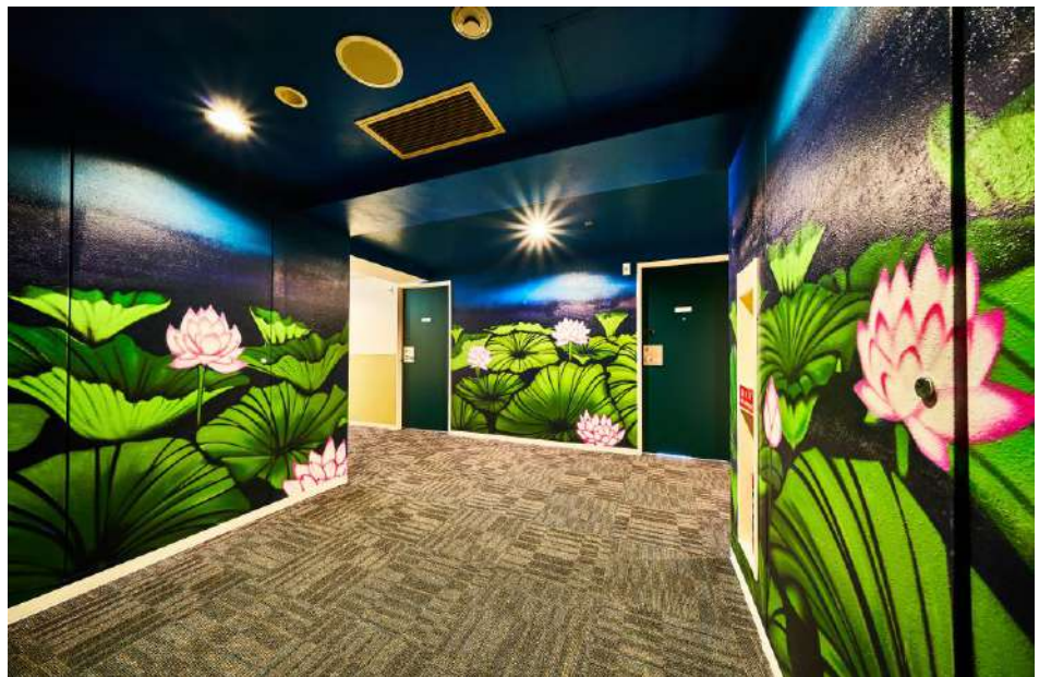
3F LOTUS POND - HASUIKE