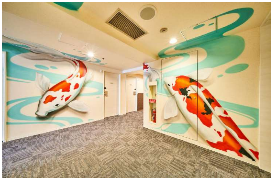
4F JAPANESE CARP